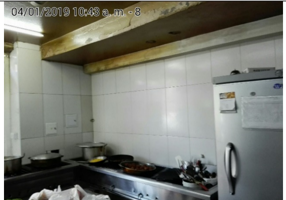
FOTOGRAFÍA N°. 4 ESTUFA DE 3 PUESTOS