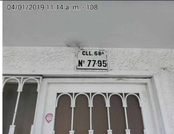
FOTOGRAFÍA N°. 2 NOMENCLATURA DEL PREDIO