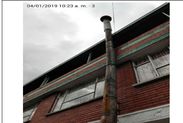
FOTOGRAFÍA N°. 5 DUCTO DEL HORNO