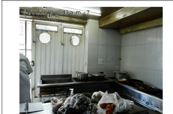
FOTOGRAFÍA N°. 3 ESTUFA DE 2 PUESTOS