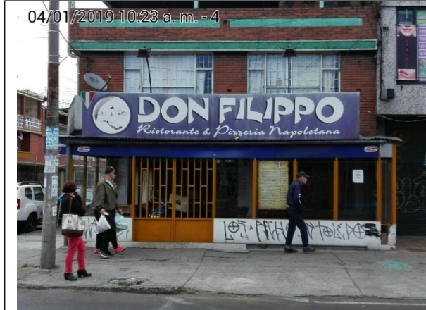
FOTOGRAFÍA N°. 1 FACHADA DEL PREDIO