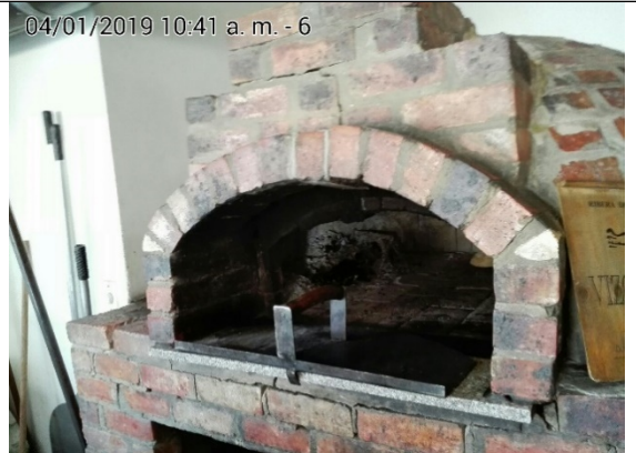
FOTOGRAFÍA N°. 6 HORNO